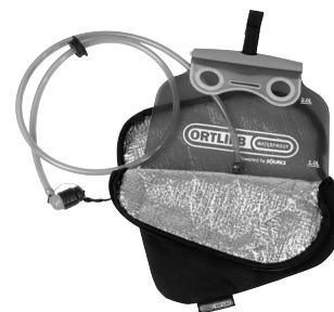
Hydration-System in ThermoSchutztasche