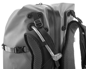
Wasserdichter Durchlass für Trinkschlauch