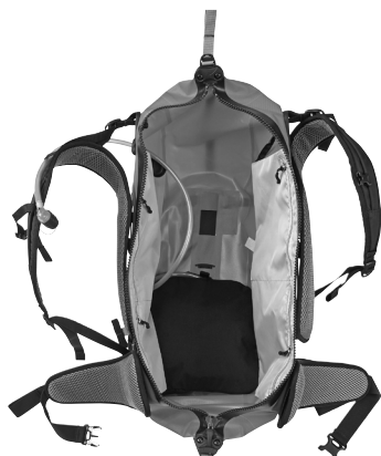
Hydration-System in Atrack