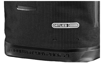
Namen- und Volumenangabe