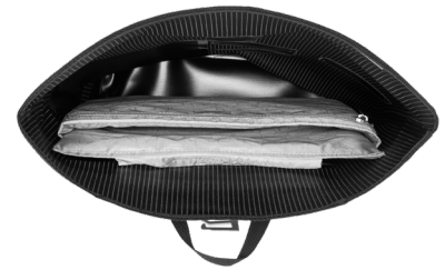
Innenansicht: gepolstertes Innenfach für Notebook (39 cm x 27 cm x 2,5 cm, 15.4 in. x 10.6 in. x 1.0 in)