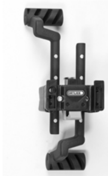
Option Montage Adapter