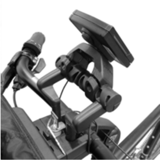
Montage E-Bike Display