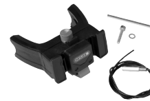
E226 Handlebar Mounting-Set E-Bike