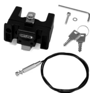
E185 Handlebar Mounting-Set with Lock