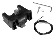
E225 Handlebar Mounting-Set