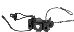
E241 Handlebar Mounting-Set QR