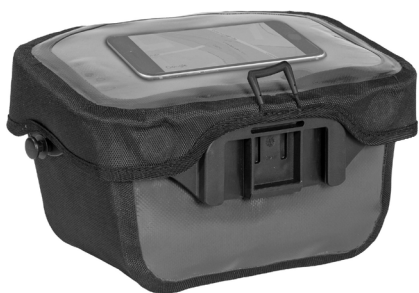
Smartphone im transparenten Deckelfach (nicht enthalten)