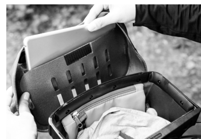
Öffnung Deckelfach: 20,5 cm