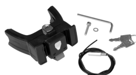
E207 Handlebar Mounting-Set E-Bike with Lock