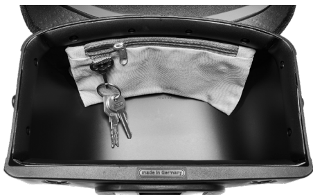
Karabiner mit Schlüsselbund