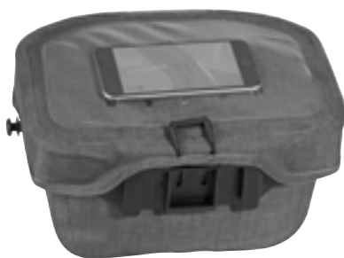
Smartphone im transparenten Deckelfach (nicht enthalten)