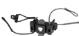
E241 Handlebar Mounting-Set QR