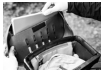
Öffnung Deckelfach: 20,5 cm