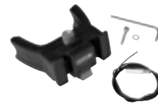
E226 Handlebar Mounting-Set E-Bike