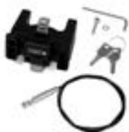
E185 Handlebar Mounting-Set with Lock