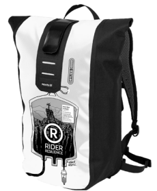
Velocity Design „Riders Resilience“