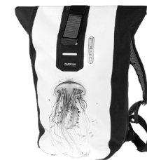
Velocity Design „Jellyfish“